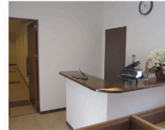
ホテルの入り口。白とダークブラウンの落ち着いた雰囲気。静かな空間です。