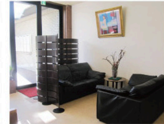
ホテルのロビー。ゆったりとしたソファで待ち時間等をお過ごしいただけます。