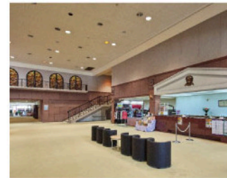
ゴルフ場のクラブハウスのフロント。ホテルは別フロアへご案内いたします。