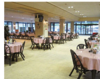
広々としたレストラン。料理長が腕を振るう豪華な食事をお楽しみいただけます。