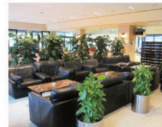
レストラン内のソファ席。深々と腰を落着ける快適なソファをご用意しました。