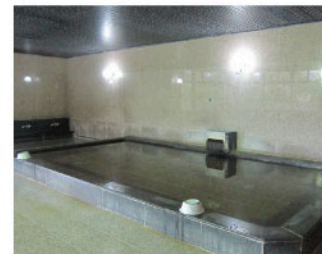
大浴場。プレー後の疲れを癒す心地よい湯加減。ゆったりとした空間。