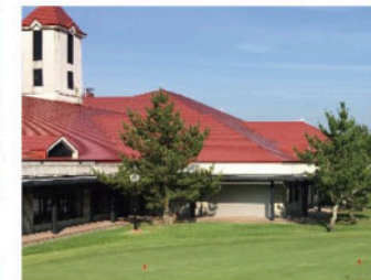
クラブハウス外観。ゴルファー達の癒しと寛ぎの空間。