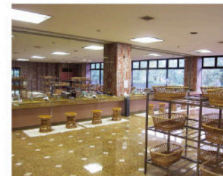
大浴場の脱衣所。清潔で広々とした室内で身支度いただけます。